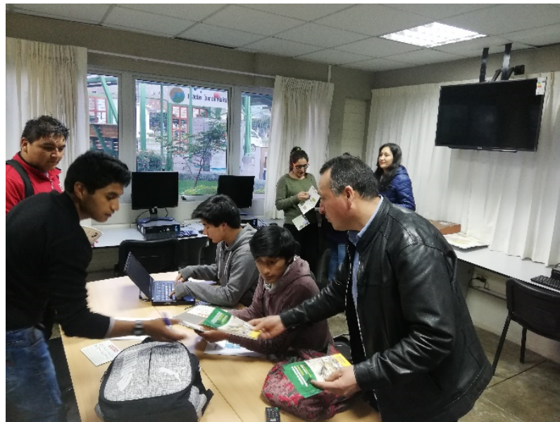
Distribución de material informativo a asistentes a la OIP