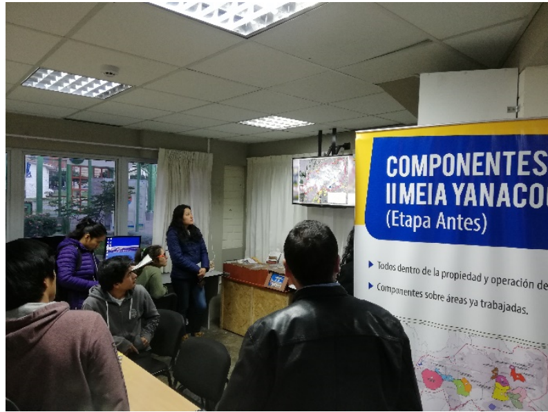
Difusión del video introductorio de la II MEIA Yanacocha