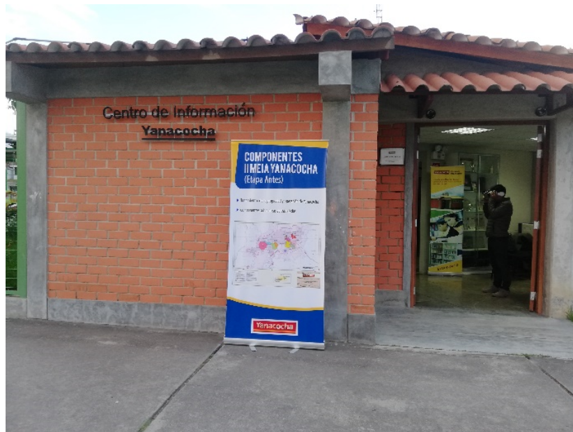
Frontis de la OIP ubicada en Jr. La Cantuta Mza. "A"- Lote 3 Complejo Qhapaq Ñan