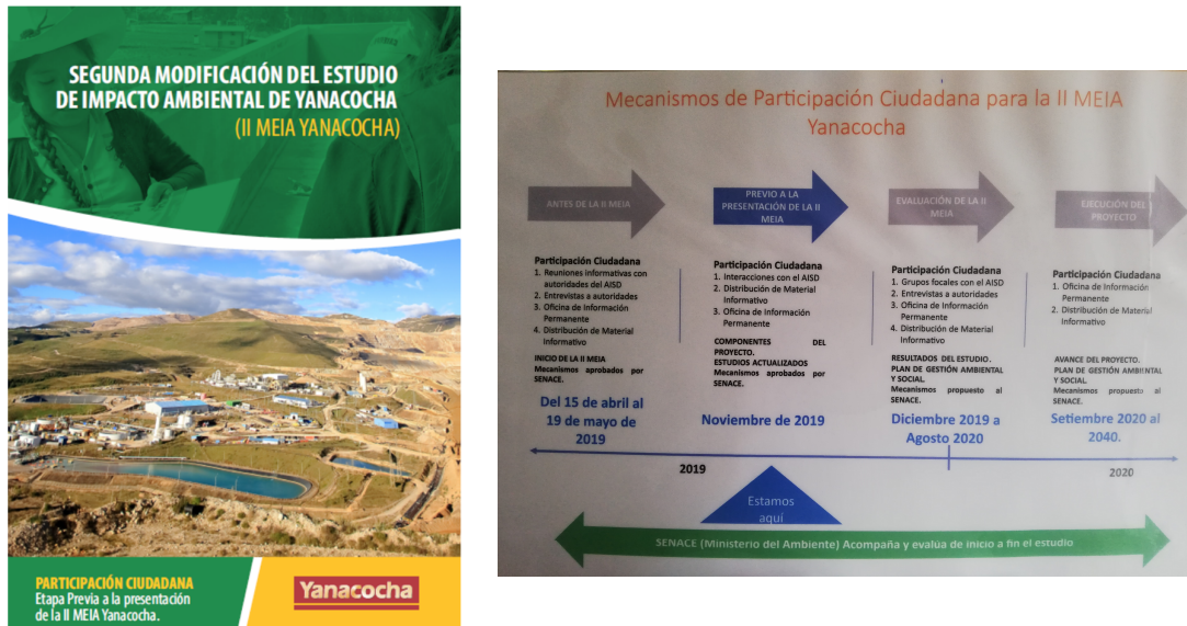
Foto 4.8.4-2 Folleto Informativo – Etapa Elaboración II MEIA Yanacochoa

Proceso de participación ciudadana de la II MEIA en imagen plastificada en formato A3. Dicho material sirvió para explicar el folleto informativo. Para el caso de las etapas de evaluación de la II MEIA y Ejecución del proyecto la información señalada es una propuesta.