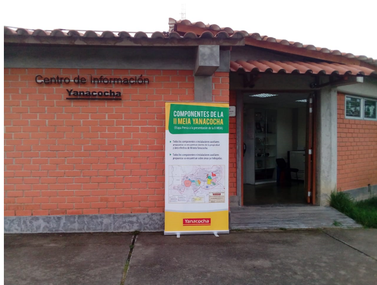
Foto 4.8.4-1 Oficina de Información Permanente (OIP) – Etapa de Elaboración y previa a la Presentación

Ubicación del banner correspondiente a la Etapa Previa a la presentación de la II MEIA en el frontis de la OIP ubicada en Jr. La Cantuta Mza. "A"- Lote 3 Complejo Qhapaq Ñan,